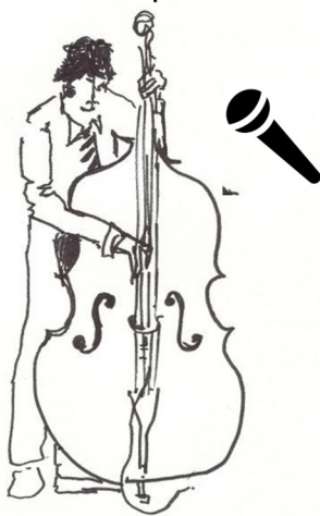
Jérôme - Contrebasse